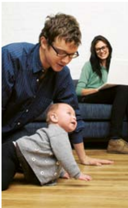
Mehr Zeit für die Familie: Junge Ärztinnen und Ärzte wollen die Kinderbetreuung gleichberechtigt mit ihren Partnern übernehmen.

Weniger wichtig sind hingegen Aspekte wie »Führungsaufgaben übernehmen« und »hohes Ansehen und Prestige genießen«. Die Studienergebnisse zeigen, dass Studierende, die in ländlichen