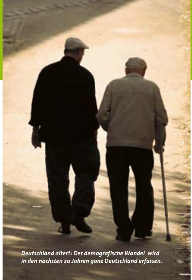
Deutschland altert: Der demografische Wandel wird in den nächsten 20 Jahren ganz Deutschland erfassen.

Ein Extrembeispiel für den demografischen Wandel in Deutschland ist die Entwicklung in Mecklenburg-Vorpommern. Hier besteht bereits eine ideale demografische Modellsituation mit allen Zuspitzungen. Bis 1989 wurden in diesem Bundesland