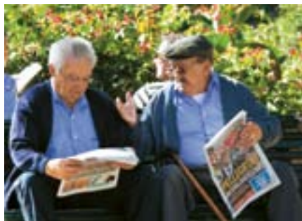
Demografieprobleme gibt es in vielen Ländern, doch die Konzepte für eine Versorgung im ländlichen Raum unterscheiden sich erheblich.

Angehenden Ärzten wird eine Tätigkeit in ländlichen Regionen jedoch nicht nur durch Theorie und Praxis während des