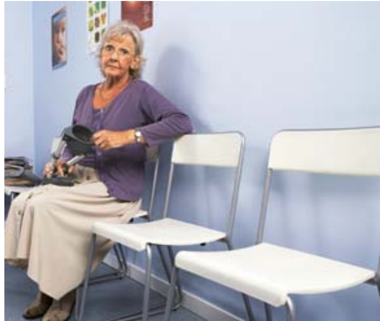
Leere Wartezimmer: Zuerst gehen die Patienten, danach auch die Ärzte. Für die zurückgebliebene, meist ältere Bevölkerung, verschlechtert sich zusehends die medizinische Versorgung.

Derzeit beruht die Honorierung der Ärzte auf kollektivvertraglichen Gesamtvergütungen, die die Krankenkassen je Versicherten an die Kassenärztlichen Vereinigungen entrichten. Die Verteilung der Honorare an die Ärzte ist fast vollständig von dem Gesamtvertrag der Krankenkasse mit der Kassenärztlichen Vereinigung entkoppelt. Die einzelne Krankenkasse kann in der Regel nur durch Sonderverträge und Zahlungen neben der Gesamtvergütung zumindest mittelbaren Einfluss