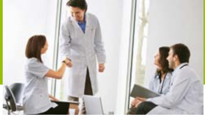
Mehr Kooperation zwischen Ärzten und anderen Heilberufen – so könnte die Versorgung auch in ländlichen Räumen gesichert werden.

größtenteils von qualifizierten Pflegekräften durchgeführt, insbesondere bei Patienten, bei denen präventive Leistungen, eine regelmäßige Überwachung der Therapie oder ein Monitoring des Gesundheitszustands erforderlich sind – also gerade bei mehrfach chronisch erkrankten Patienten, wie sie das Versorgungsgeschehen angesichts der demografischen Entwicklung zunehmend bestimmen werden. Der verstärkte Einsatz von nichtärztlichen Fachkräften bietet zudem gute Chancen für eine bessere Kooperation zwischen medizinischer Versorgung und Pflege. Schließlich sind viele alte Menschen oft nicht nur chronisch krank, sondern gleichzeitig auch pflegebedürftig.